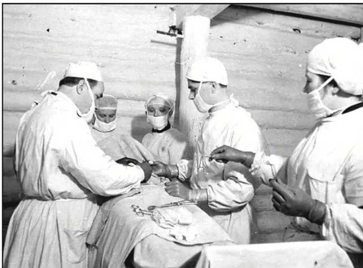
■ В военное время врачи спасли 10 миллионов солдат

За боевые заслуги награждены званием Героя Советско-